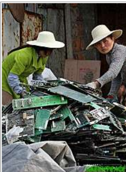
圖案 2: 當地的婦女正在為電路板分類，以便之後「烤電路板」的處理。