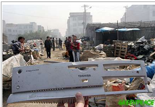
圖案 1: 貴嶼鎮街道兩旁堆滿了電子垃圾，圖中手拿的為電腦主機前面板。

最近的一則令人「振奮」的新聞，美國麻省理工學院要設計 100 美元的筆記型電腦，以提供第三世界國家或貧窮的人口，企圖縮減他們的數位「落差」。國內最大的筆記型電腦代工廠商廣達電腦，日前則簽下了由麻省理工學院主導的合約，取得未來量產的機會，而這個市場之大，瞄準了中國、印度、東南亞國家等人口眾多、國民所得較低的地方。對於企業而言，要賺錢又要低成本，必然得要以量治價 1 。